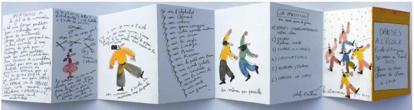
leprello dessiné par Isabelle R. / en vrai pour de faux - école élémentaire d'Engins - avril 2023

Après avoir joué avec l'espace de leur classe, nous proposerons un temps d'échange avec l'équipe artistique.