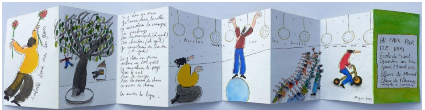
leprello dessiné par Isabelle R. / en vrai pour de faux - école maternelle de saint-Quentin sur Isère - avril 2023

Les livrets permettront de témoigner des perceptions nouvelles et sensibles de l'espace de la classe apparues suite au projet.