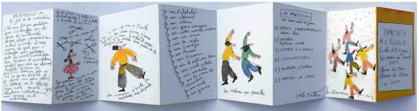
leprelo dessiné par Isabelle / en vrai pour de faux - école élémentaire d'Engins - avril 2023

Comme des apprentis chercheurs, les élèves et l'enseignant vont pouvoir ré-activer ce qui se passe pendant le spectacle et rejouer à leur tour la partition du spectacle. Dans un premier temps, les danseurs vont déplier avec les élèves les principes du spectacle : l'espace, les usages dans la classe, la chorégraphie des postures et des gestes du quotidien, danser avec le mobilier, les mots... Les élèves feront ainsi à leur tour une micro-performance dans la classe. Ce temps de laboratoire avec chaque classe leur permet de jouer avec l'espace de leur classe et d'avoir un temps d'échanges avec l'équipe artistique.