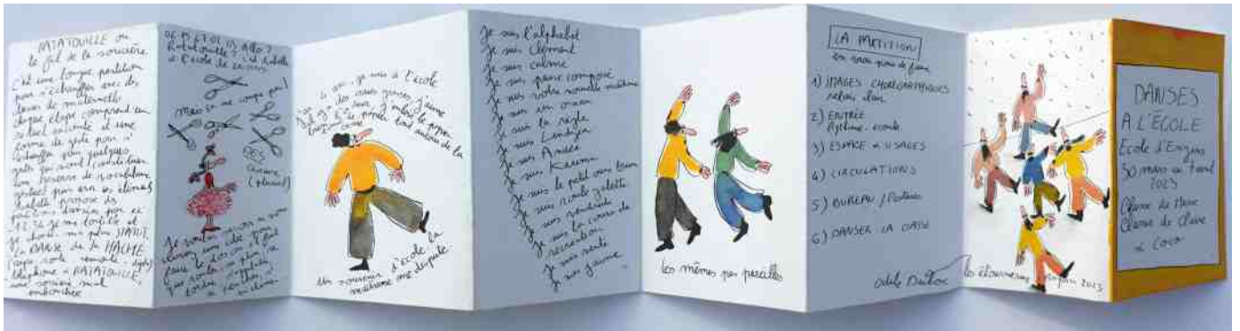
leprello dessiné par Isabelle R. / en vrai pour de faux - école élémentaire d'Engins - avril 2023

Comme des apprentis chercheurs, les élèves et l'enseignant vont pouvoir ré-activer ce qui se passe pendant le spectacle et rejouer à leur tour la partition du spectacle. Dans un premier temps, les danseurs vont déplier avec les élèves les principes du spectacle : l'espace, les usages dans la classe, la chorégraphie des postures et des gestes du quotidien, danser avec le mobilier, les mots... Les élèves feront ainsi à leur tour une micro-performance dans la classe. Ce temps de laboratoire permet de jouer avec l'espace de leur classe et d'avoir un temps d'échanges avec l'équipe artistique.